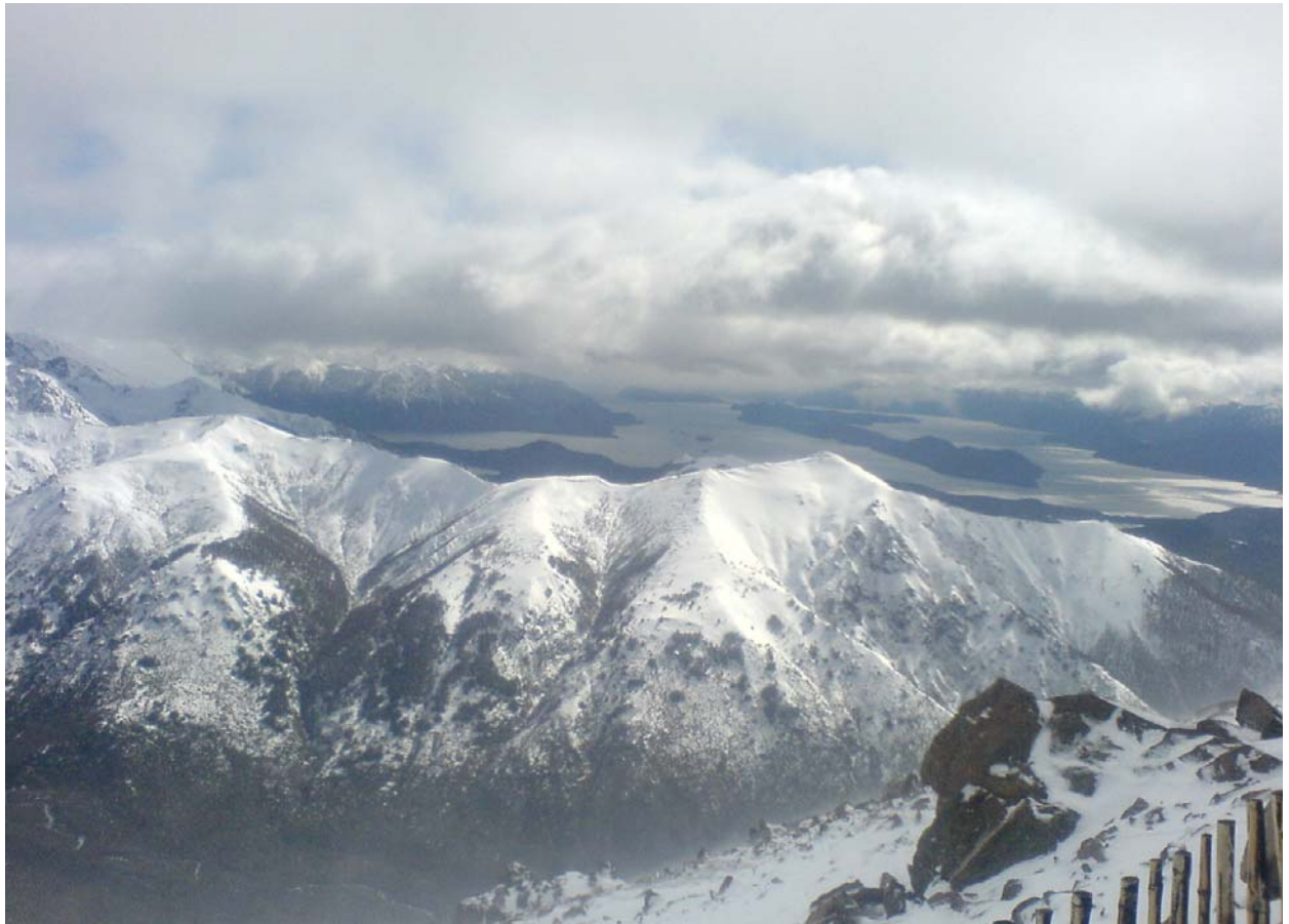
Cerro Cathedral – der Skiberg von Bariloche – die Aussicht ist einfach de Hammer!