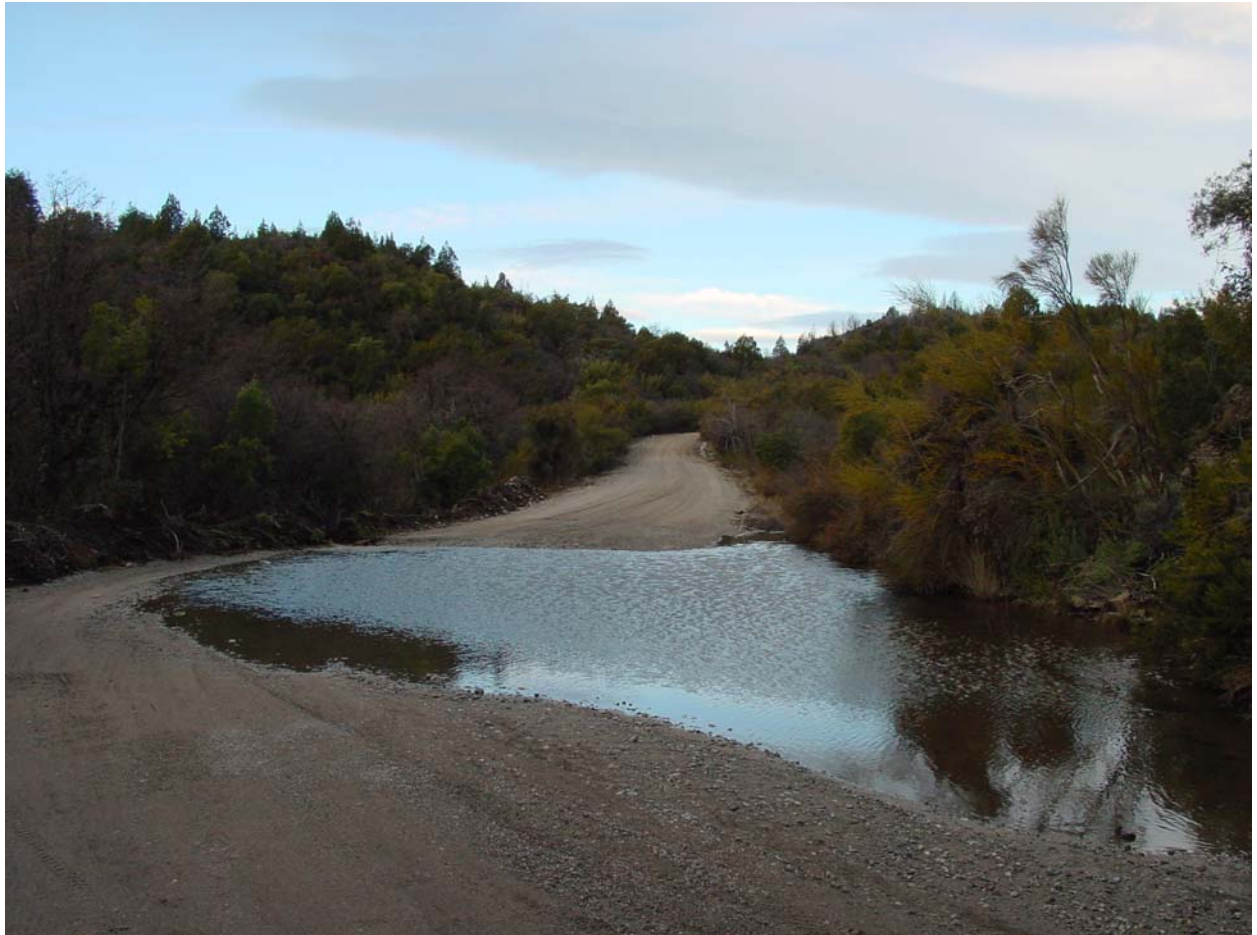
Ausfahrt in Bariloche – mit Gratis Unterbodenwäsche fürs Auto (oben wärs auch nötig)