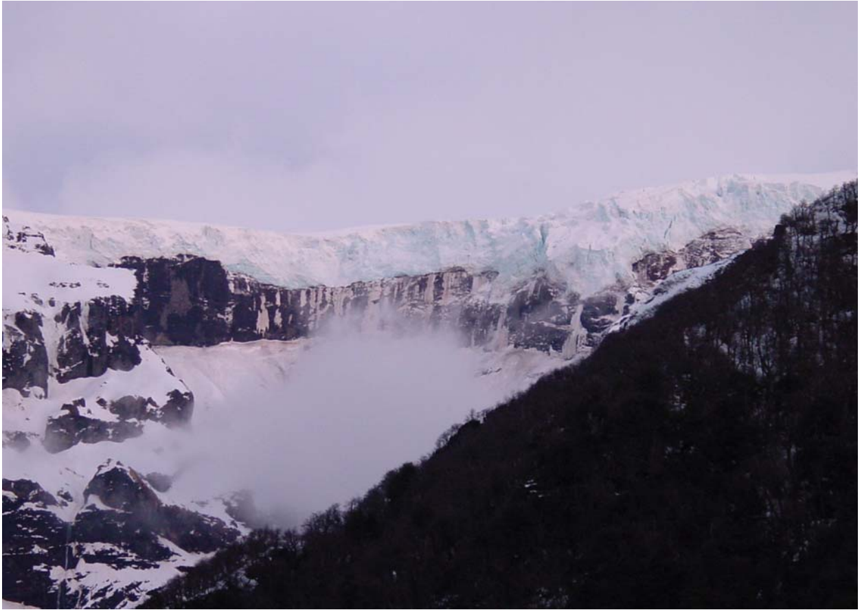
Die Gegend rund um Bariloche ist super schön.