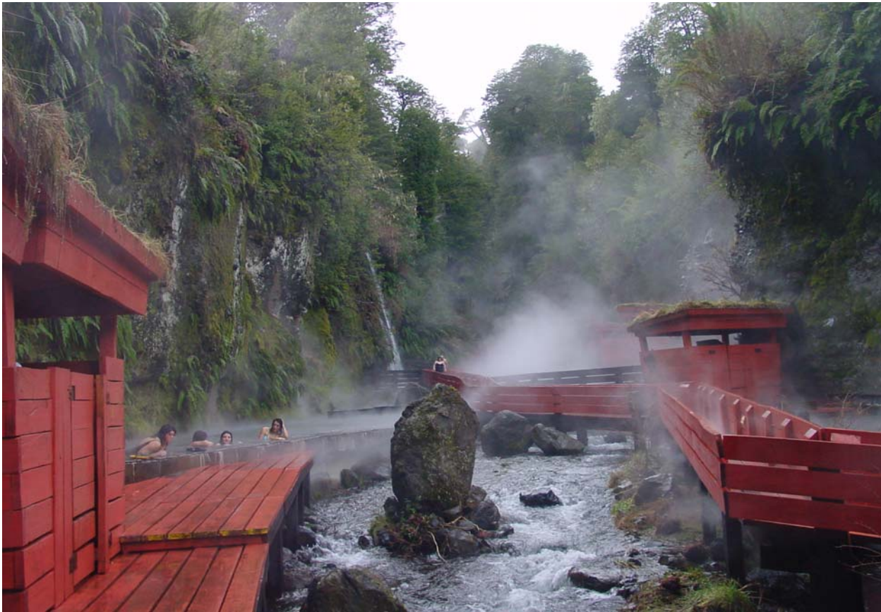
Thermen Geometricas noch in Chile – genial...