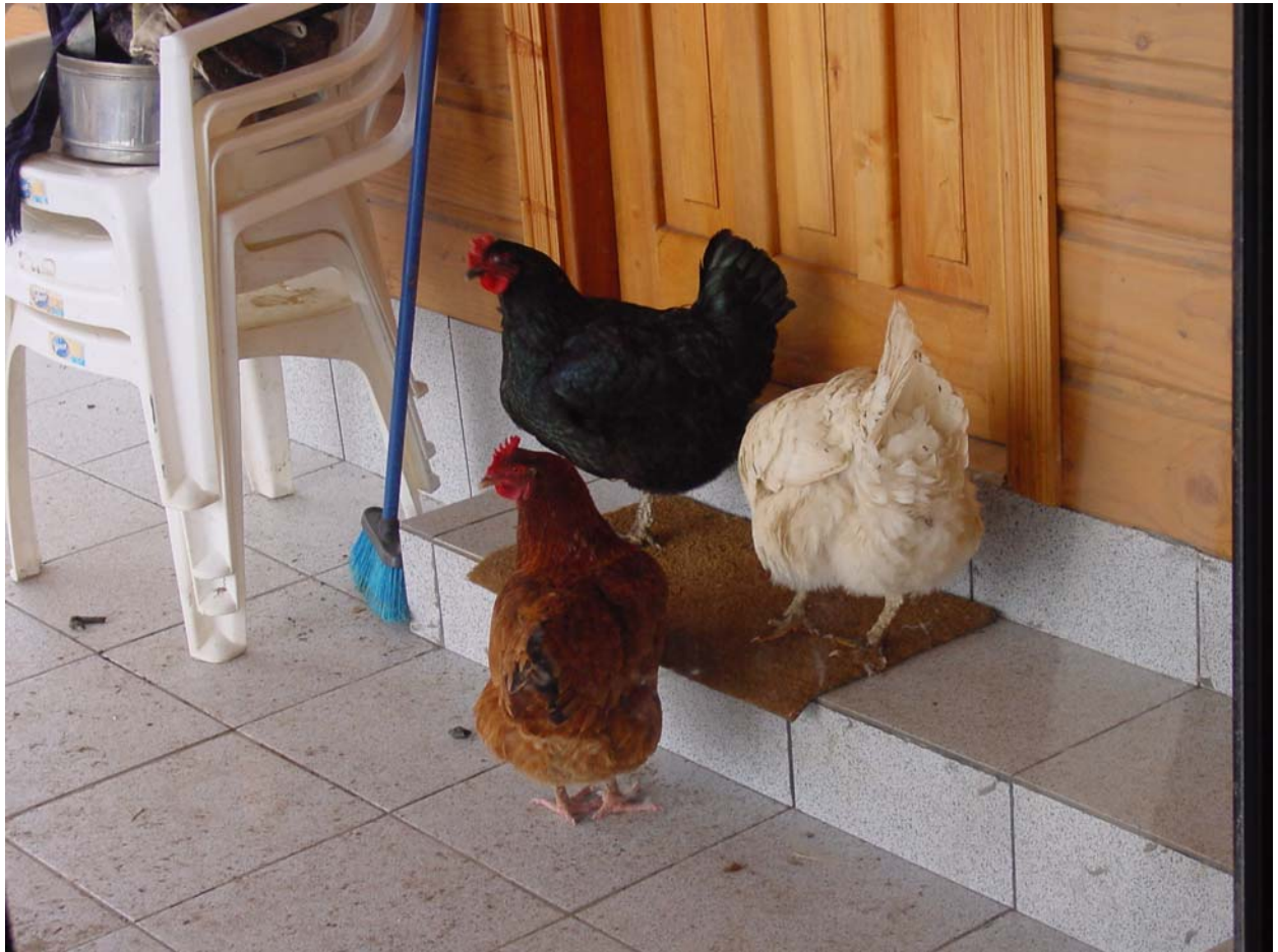
... die Frühstücksei-Lieferung wartet vor der Türe.....