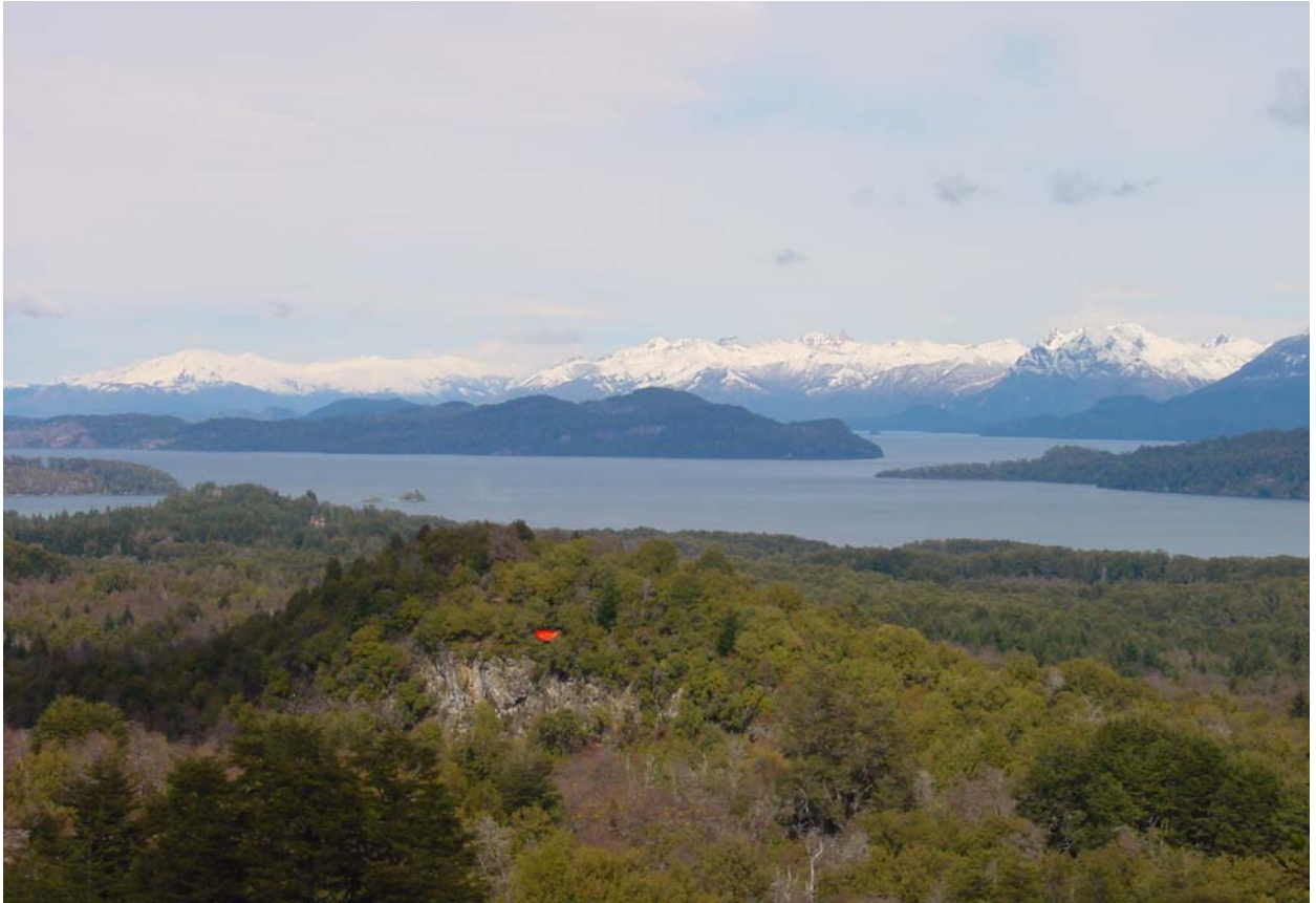
Villa La Angostura und das Restaurant Heidi in der Colonia Suiza in Bariloche