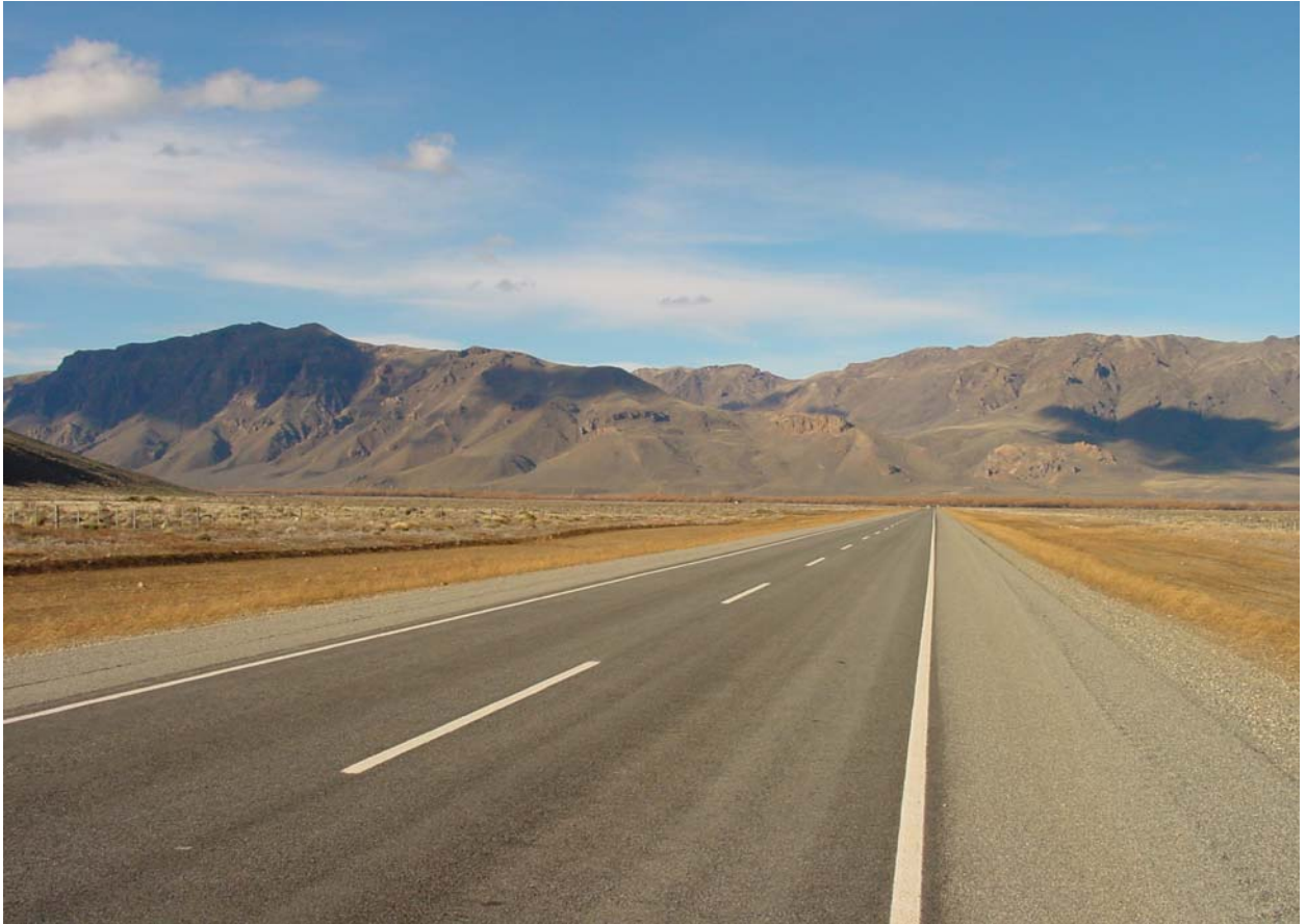
Rückfahrt bei via Maitén / auch die mit nur 1 PS müssen tanken...