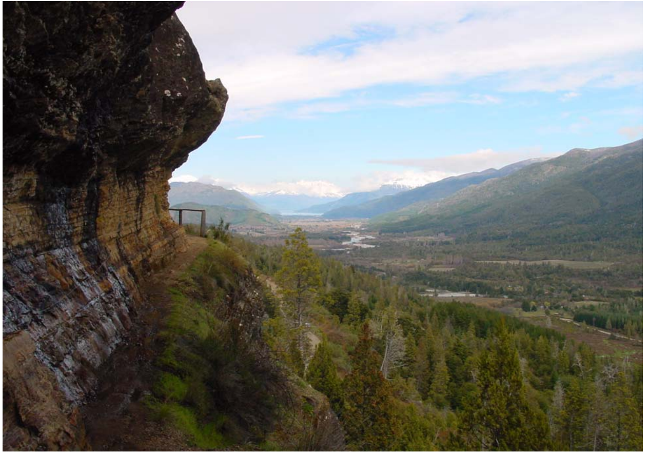
Wanderweg in El Bolson