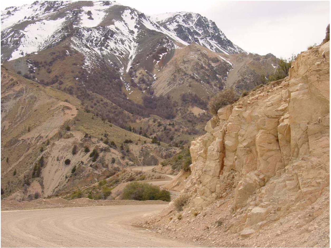
Strasse hoch zum Skigebiet La Hoya in Esquel