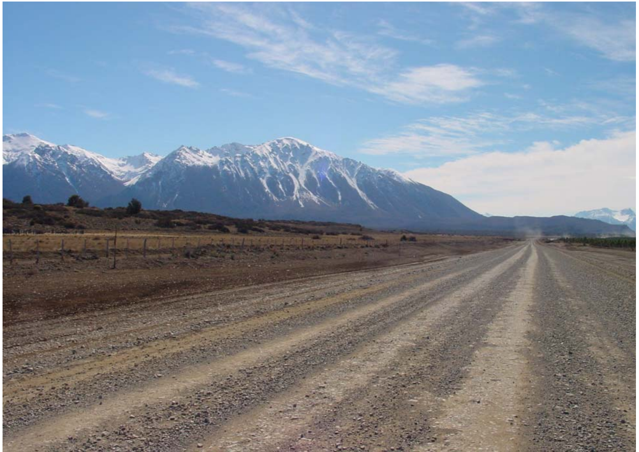
zum Nationalpark Los Alerces – Schotterpisten.....