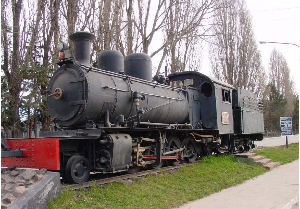
Die alten Dampzüge in Maitén