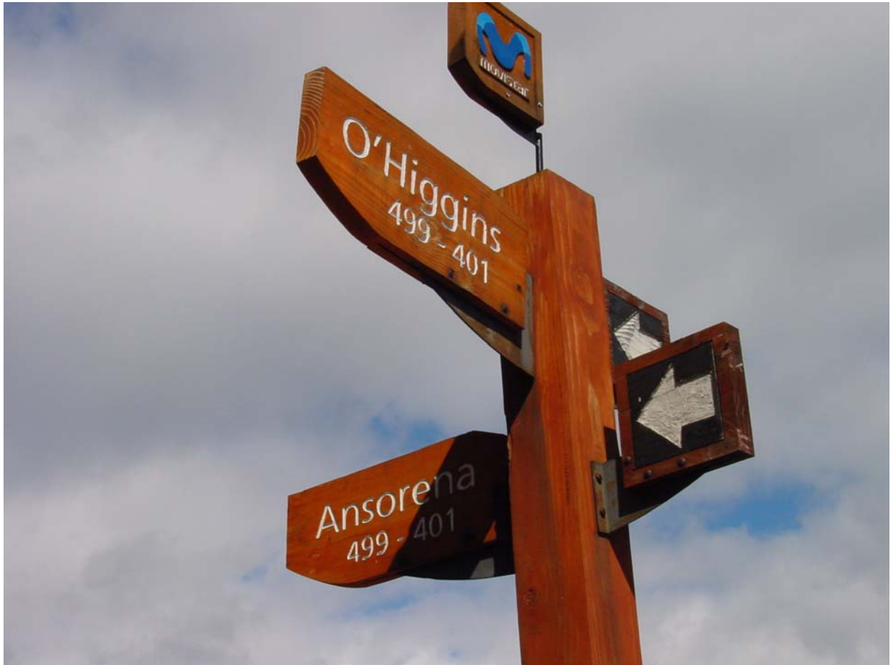
Strassentafeln in Pucon - die kleine Pfeile (Einbahnen) / unten: Valdivia