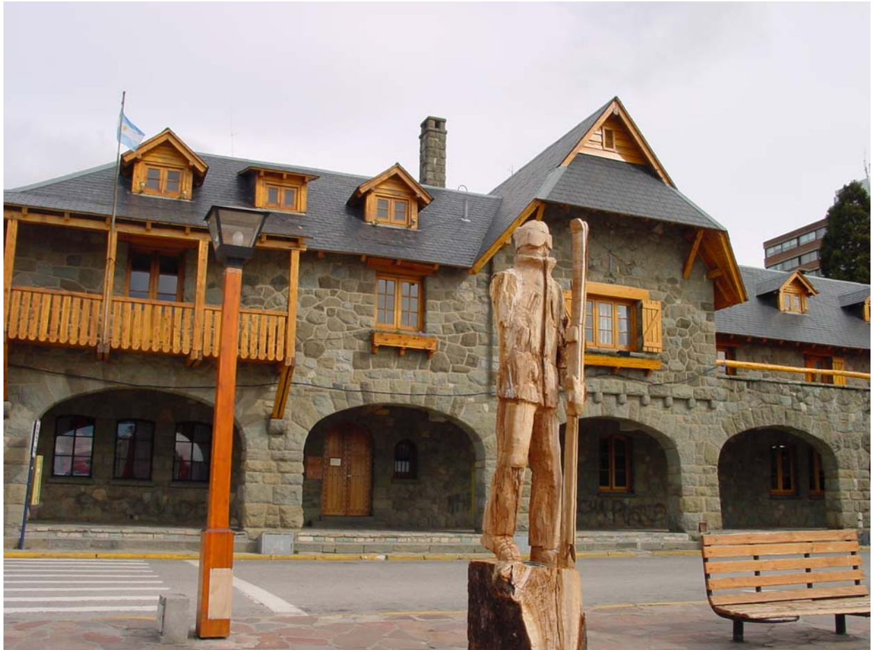
Bari – wartet in Bariloche auf Touristen, die mit ihm aufs Photo wollen (gegen Bezahlung natürlich....)